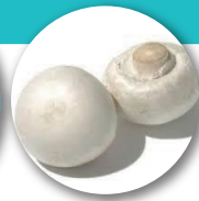
シアンピニオンエキス